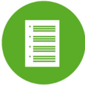
Plan for retting