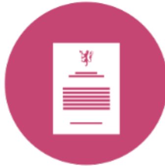
Pålegg om retting